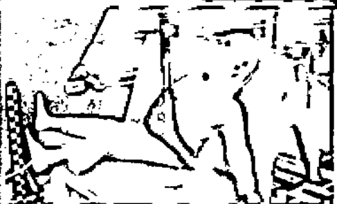
Результаты тестов использования безопасных удерживающих устройств

Дополнение определения «направляющая лямка» в Правилах ЕЭК ООН № 44-04 было одобрено Всемирным Форумом (WP.29). Внесенная поправка к формулировке указывает на то, что «направляющая лямка рассматривается как составной элемент детской удерживающей системы и НЕ может отдельно официально утверждаться в качестве детской удерживающей системы в соответствии с настоящими Правилами». Это исключает даже формальную возможность сертификации устройств типа «направляющая лямка»!